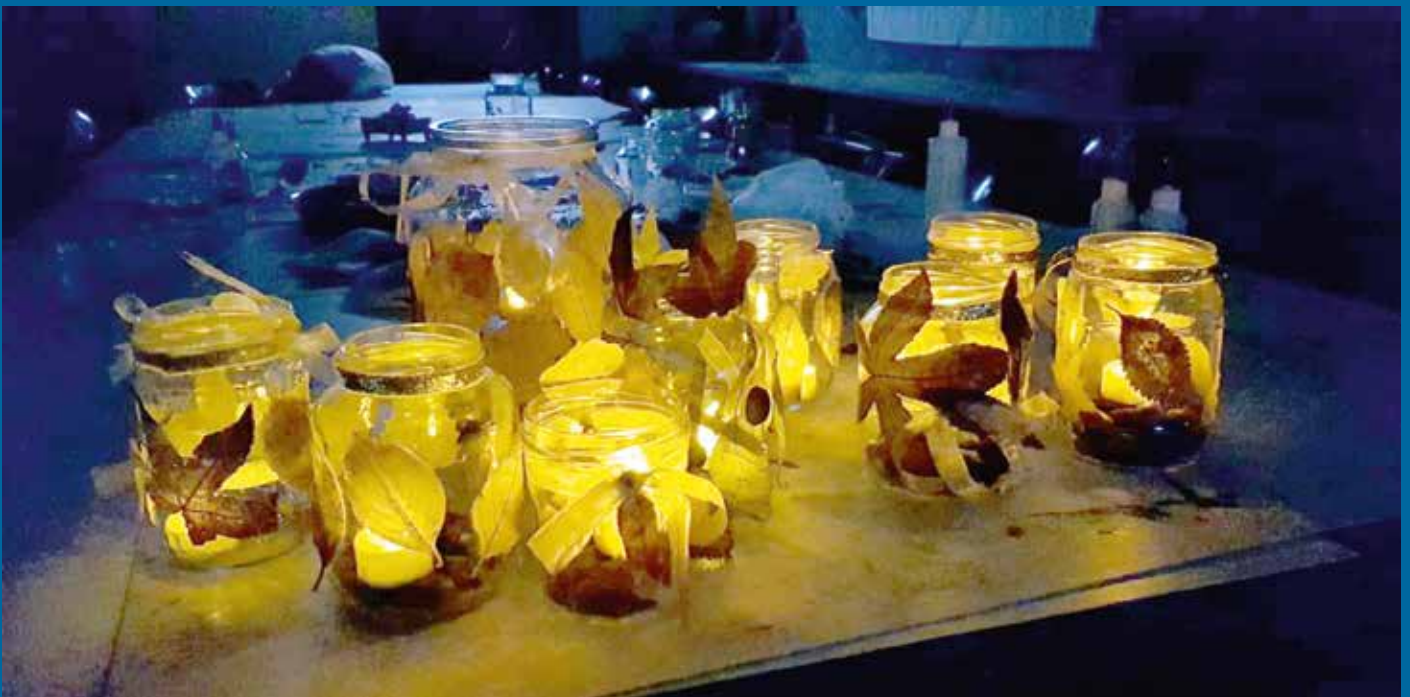
Dit zijn de werkjes die de kinderen deze middag hebben gemaakt: glazen potjes beplakt met herfstbladeren.