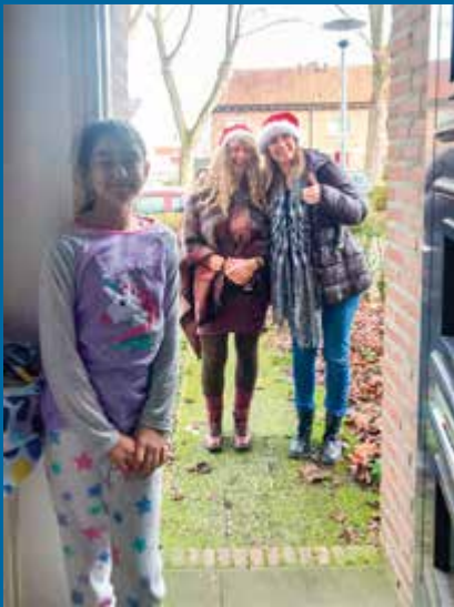
In de kerstvakantie kreeg ieder kind een tasje met verrassingen thuisbezorgd

en over de achterstand die ze oplopen. Ik heb ook aangeboden om te helpen met lezen, want voor moeders met een buitenlandse afkomst is het lastig om in het Nederlands te lezen. Het was fijn om zo een paar middagen even contact te hebben en op een andere manier in het gezin aanwezig te zijn. Gelukkig neemt de school dat nu weer over.